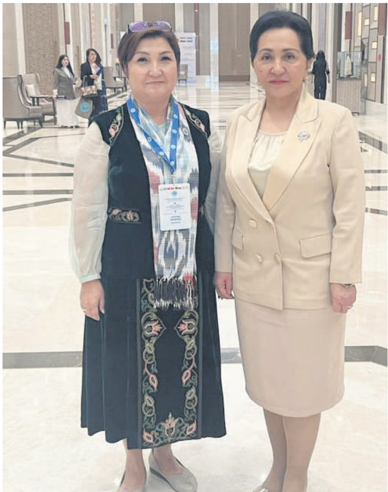
Өзбекстандын Олий Межлисинин Сенатынын Төрайымы Нарбаева Танзила Камаловна менен

- Бул залкар киши Кыргызстан КП БКнын 1-катчысы кезинде жаңылбасам 4-5 ирет жолуккам. Айттым го, мен анда окуучу куракта болчумун. Азыркы Ак үйдүн 7-кабатында отурчу. Улуу кишинин улуулугуна, а эң башкысы жөнөкөйлүгүнө ар бир жолугушкан сайын таасирленип, ушунчалык тан бергем. Мектептеги кезде өлкөбүздүн атынан Ташкенттеги, Ленинграддагы, Москвадагы жаштардын форумуна катышып жүрдүм. Ошондой форумдарга барардын астында сөзсүз Абсамат Масалиевичке, Ренат Сатаровичке кирип, ал кишилердин жол көрсөтүүлөрүн, насааттарын угуп жөнөчүбүз. Мындай көрүнүш ал убакта салт болуп калган. Ошондой убакта аты аталган залкар инсандар менен сүйлөшүп, суроо берип, жакындан таанышуу бактысы менин мектептеги курагыма дал келген. Азыр ойлосом кичинемде тайманбас, өткүр