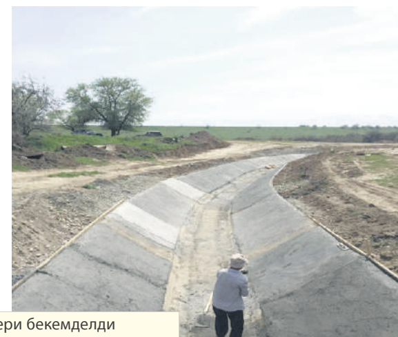
Батыш Чоң Чүй каналында бетон иштери бекемделди