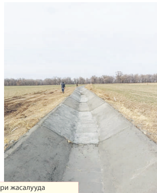
Ысык-Ата районундагы Р-2-1 каналында бетон иштери жасалууда