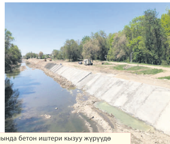
Аламүдүн районунда Р-1-1 каналында бетон иштери кызуу жүрүүдө