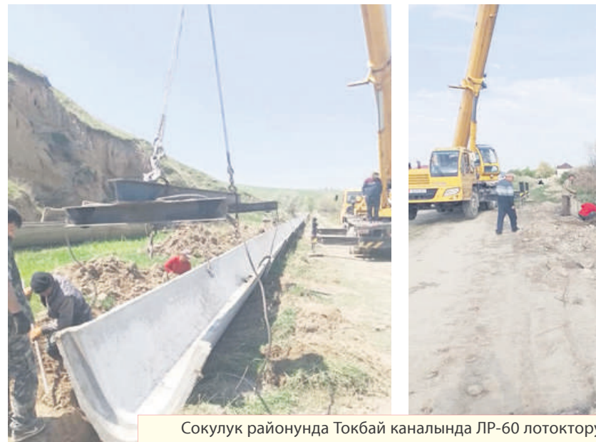
Сокулук районунда Токбай каналында ЛР-60 лотокторду

Облусубуз боюнча алганда сугат жер аянты 320,879 миң гектар. Мына ушул даркан талааларды сугарууга жетиштүү суу бөлүү башкы милдеттерибиз болуп саналат. Аталган жалпы аянттын ичинен 272,743 миң гектары чарба аралык тармактардын, ал эми 48,136 миң гектары ички чарба аралык тармактардын сугат суусу менен сугарылат. Тактап айтсак: Жайыл районунда 42,468 миң гектар, Панфилов районунда