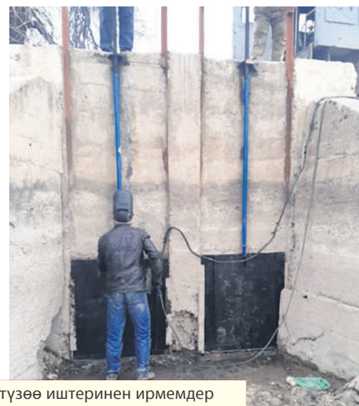
Батыш Чоң Чүй каналындагы гидротехникалык курулмаларды оңдоп-түзөө иштеринен ирмемдер