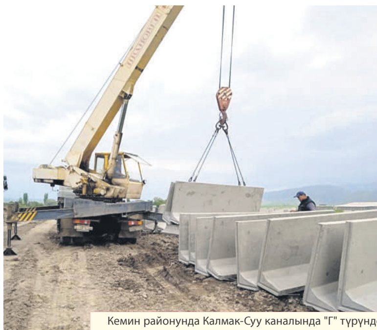
Кемин районунда Калмак-Суу каналында "Г" түрүндөгү блокторду монтаждоо иштери илгерилөөдө