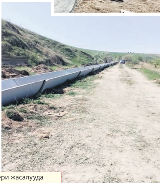
ун ЛР-80 алмаштыруу иштери жасалууда