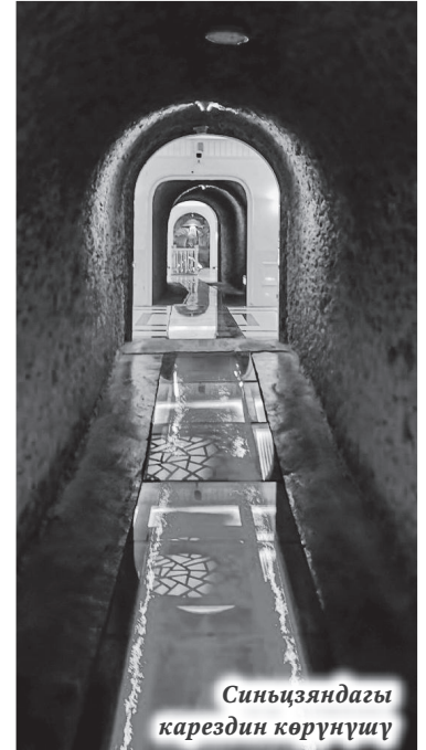
Синьцзяндагы карездин көрүнүшү

Учурда Синьцзяндагы алты жүздөн ашык карездин төрт жүздөйү Турпанда жайгашкан. Кээ бир айылдарда карездер бүгүнкү күндө да сугаруу иштеринде, экологиялык жактан нукура булак суусу болгондуктан, ичүүчү суу катары да колдонулат. Акылман синьц-