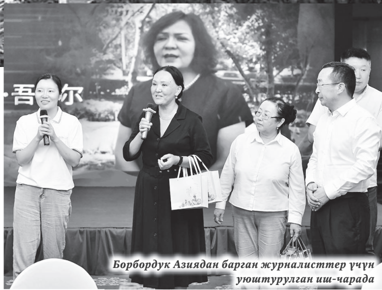
Борбордук Азиядан барган журналисттер үчүн уюштурулган иш-чарада

Турпан Кытайдын эң ысык шаары. Чөлдүн ортосундагы жашыл оазис. Дүйнөдөгү эң кургак жерлердин бири болгон Турпан шаарын жергиликтүүлөр «От өлкөсү» деп аташат. Жайында абанын басымы +50 Сге чейин жетерин айтты. Ал Улуу Жибек Жолундагы маанилүү соода жана маданий борбор гана болбостон, байыркы кербен жолунун түндүк тармагындагы стратегиялык пост болгон. Шаар ар тараптан чөлдөр жана тоолор, кыйраган орто кылымдагы