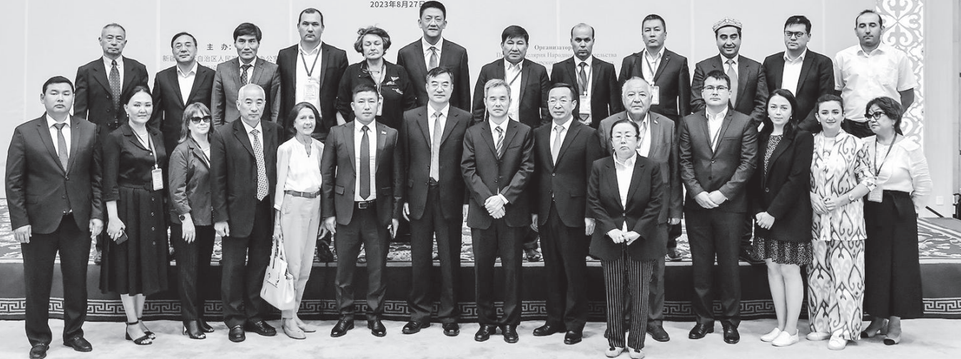
Борбордук Азиядан барган жана Синьцзяндагы медиа делегациясынын өкүлдөрү