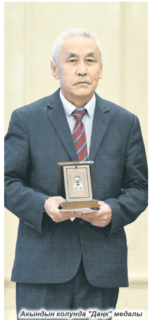
Акындын колунда “Даңк” медалы