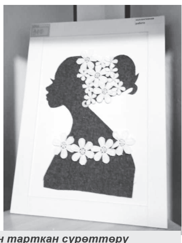
Маликанын ийне менен тарткан сүрөттөрү