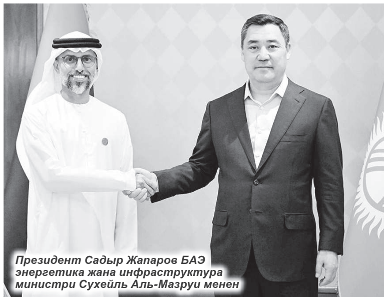
Президент Садыр Жапаров БАЭ энергетика жана инфраструктура министри Сухейль Аль-Мазруи менен

Мындан сырткары, Садыр Жапаровдун катышуусунда Кыргызстандын Энергетика министрлиги менен «Abu Dhabi Future energy company PJSC-Masdar» жана «Électricité de France» компанияларынын ортосунда үч тараптуу Өз ара түшүнүшү жөнүндө меморандумга кол коюу аземи болду. Андан кийин эки компаниянын өкүлдөрү менен сүйлөшүүлөр жүрдү. Президент Садыр Жапаров жолугушуунун катышуучуларын өлкөнүн гидроэнергетикалык потенциалына өзгөчө көңүл бурууга чакырып, Кыргызстан «жашыл экономиканы» өнүктүрүүгө туруктуу багыт алганын баса белгиледи.