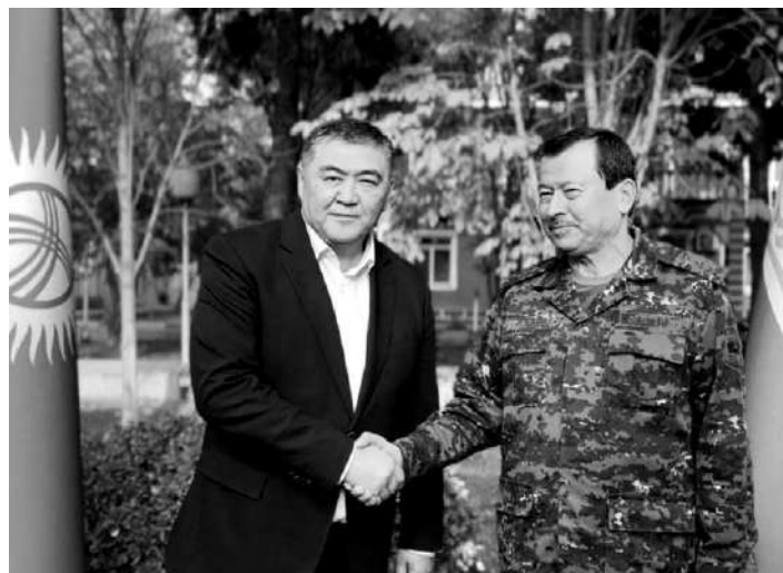
3-ноябрда Акылбек Жапаров жаңы жылга чейин чек арасынын ачыларын билдирип: “Кыргызстан менен Тажикстандын

Тажикстандын Согди облусунун Бустон шаарында кыргыз-тажик мамлекеттик чек арасын делимитациялоо жана демаркациялоо боюнча Кыргызстан менен Тажикстандын өкмөттүк делегацияларынын теңтөрагалары Камчыбек Ташиев жана Саймумин Ятимов жолугушту.